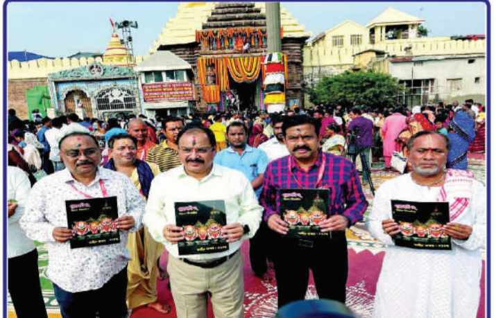
ତା ୨୭.୧୧.୨୩ ରେ ଶ୍ରୀମନ୍ଦିର ପ୍ରଶାସନ ତରଫରୁ ପ୍ରକାଶିତ 'ଶ୍ରୀମନ୍ଦିର (କାର୍ତ୍ତିକ ସଂଖ୍ୟା-୨୦୨୩) ପତ୍ରିକା'କୁ ଶ୍ରୀମନ୍ଦିର ମୁଖ୍ୟ ପ୍ରଶାସକ ଶ୍ରୀଯୁକ୍ତ ରଂଜନ କୁମାର ଦାସ ସିଂହଦ୍ୱାରା ସମ୍ମୁଖରେ ପ୍ରଶାସନର ଅଧିକାରୀମାନଙ୍କ ଗହଣରେ ଲୋକାର୍ପଣ କରୁଅଛନ୍ତି