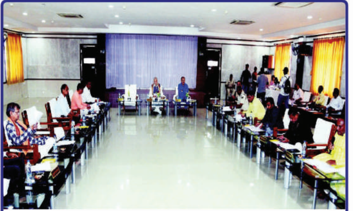
ତା. ୪.୧୧.୨୩ରେ ନୀଳାଦ୍ରି ଭଞ୍ଜନିବାସ ଠାରେ ଗଜପତି ମହାରାଜା ଶ୍ରୀ ଶ୍ରୀ ଦିବ୍ୟସିଂହ ଦେବଙ୍କ ଅଧିକ୍ଷତାରେ ଆହୂତ 'ଶ୍ରୀମନ୍ଦିର ପରିଷ୍କଳନା କମିଟି' ବୈଠକ