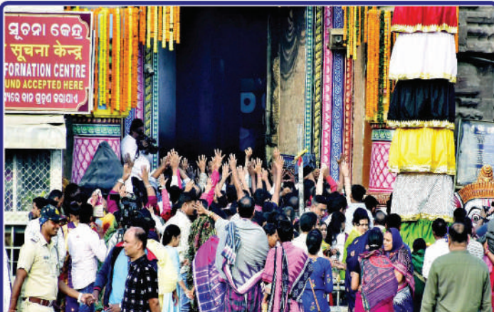
ତା ୨୭.୧୧.୨୩ ରେ ପବିତ୍ର କାର୍ତ୍ତିକ ପୂର୍ଣ୍ଣିମା ପରିପ୍ରେକ୍ଷୀରେ ଶ୍ରୀକାଳୁ ଭକ୍ତମାନେ ଆନନ୍ଦ-ଉଲ୍ଲାସ ସହ ମହାପ୍ରଭୁଙ୍କ ଦର୍ଶନ ନିମନ୍ତେ ଶ୍ରୀମନ୍ଦିରକୁ ପ୍ରବେଶ କରୁଅଛନ୍ତି