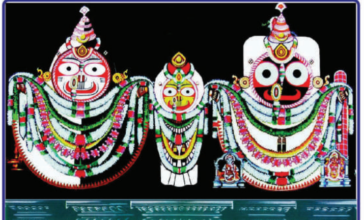
ତା ୨୦.୧୧.୨୩ ରେ ଶ୍ରୀମନ୍ଦିରରେ ବଡ଼ ଠାକୁର ପ୍ରଭୁ ଶ୍ରୀବଳଭଦ୍ରଙ୍କ ଅନୁଷ୍ଠିତ ହରିହର ବେଶ