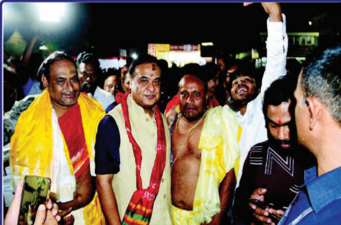
ତା ୨୬.୧୧.୨୩ ରେ ଆସାମର ମାନ୍ୟବର ମୁଖ୍ୟମନ୍ତ୍ରୀ ଶ୍ରୀଯୁକ୍ତ ହିମେନ୍ଦ୍ର ବିଶ୍ୱଶର୍ମା ଶ୍ରୀମନ୍ଦିରରୁ ଶ୍ରୀବିଗ୍ରହମାନଙ୍କ ଦର୍ଶନ ସାରି ଫେରୁଅଛନ୍ତି