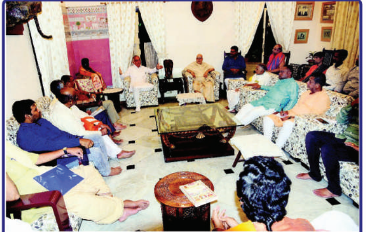
ତା. ୩.୧୧.୨୩ରେ ଶ୍ରୀନହର ଠାରେ ଗଜପତି ମହାରାଜା ଶ୍ରୀ ଶ୍ରୀ ଦିବ୍ୟସିଂହ ଦେବଙ୍କ ଅଧିକ୍ଷତାରେ ଏବଂ ଶ୍ରୀମନ୍ଦିର ମୁଖ୍ୟ ପ୍ରଶାସକ ଶ୍ରୀମୁକ୍ତ ରଂଜନ କୁମାର ଦାସଙ୍କ ଉପସ୍ଥିତିରେ ଆହୂତ 'ଶ୍ରୀମନ୍ଦିର ନୀତି ସବ୍-କମିଟି' ବୈଠକ